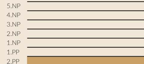
schématický řez objektem - schéma / conceptual building section - scheme