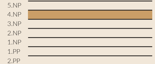
schématický řez objektem - schéma / conceptual building section - scheme