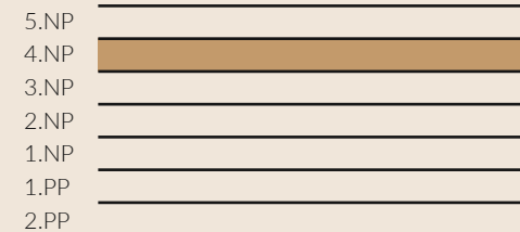
schématický řez objektem - schéma / conceptual building section - scheme