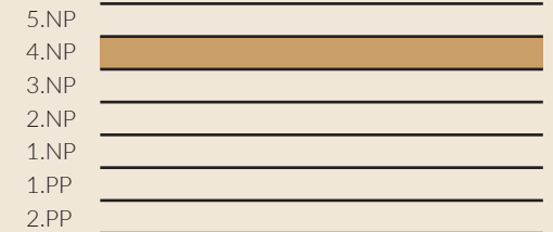
schématický řez objektem - schéma / conceptual building section - scheme