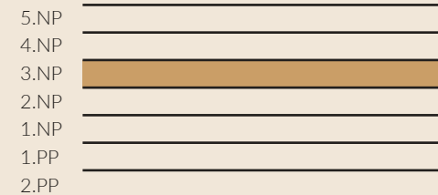
schématický řez objektem - schéma / conceptual building section - scheme