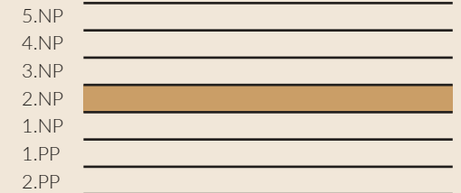
schématický řez objektem - schéma / conceptual building section - scheme