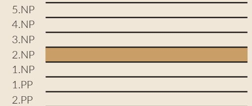
schématický řez objektem - schéma / conceptual building section - scheme